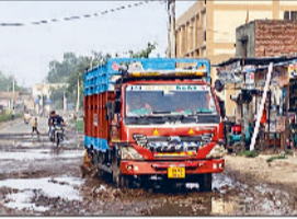
चालक दुर्घटना का शिकार होते होते बचे हैं।