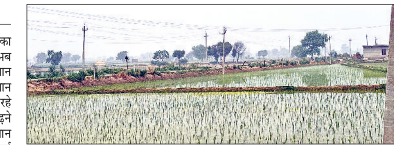
उचाना। खेतों में की गई धान की रोपाई।

प्री-मानसून के बाद क्षेत्र में धान की रोपाई का काम शुरू हो गया है। प्री-मानसून के बाद अब मानसून ने भी हरियाणा में दस्तक दे दी है। धान की रोपाई के लिए किसान बारिश का इंतजार कर रहे थे। इस बार तापमान बढ़ने से किसानों द्वारा धान रोपाई के लिए तैयार की गई प्योद भी खराब हुई। किसानों को प्रति एकड़ 1500 से दो हजार रुपये का नुकसान भी हुआ। अब बारिश के बाद किसानों ने धान रोपाई शुरू कर दी है। इस बार धान की रोपाई क्षेत्र में अधिक होगी क्योंकि कपास की फसल में कई