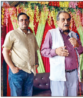
उचाना। मीटिंग को संबोधित करते हुए पूर्व केंद्रीय मंत्री बीरेंद्र सिंह साथ में खंड पूर्व सांसद बृजेंद्र सिंह।

उचाना हलके में बीते कई दिनों से चल रहे कांग्रेस नेता एवं पूर्व सांसद बृजेंद्र सिंह के कार्यक्रमों को सफल बनाने में अहम भूमिका निभाने वाले कार्यकर्ताओं के लिए कार्यक्रम राजबाहा रोड स्थित पैलेस में आयोजित हुआ। मुख्य वक्ता के तौर पर पूर्व केंद्रीय मंत्री बीरेंद्र सिंह, पूर्व सांसद बृजेंद्र सिंह पहुंचे। यहां पर विधानसभा चुनाव को लेकर भी चर्चा हुई। गांव, बूथ स्तर पर अधिक से अधिक लोगों को जोड़ने को लेकर भी चर्चा हुई। पूर्व केंद्रीय मंत्री बीरेंद्र सिंह ने कहा कि मेरी सबसे बड़ी ताकत मेरे कार्यकर्ता हैं। राजनीतिक जीवन में 52 साल में राजनीतिक के हर बुरे, अच्छे दौर में मेरे साथ रहे। जब पूरे प्रदेश में कांग्रेस