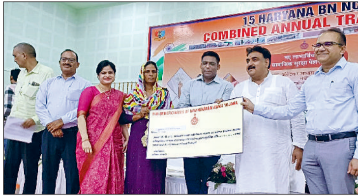
जीद। लाभ पात्रों को सहायता राशि का चेक देते हुए विधायक।

लाख रुपये की आर्थिक सहायता प्रदान की गई। इसी प्रकार से सामाजिक सुरक्षा पेंशन योजना के तहत नई पेंशन योजना और डा. बीआर अंबेडकर आवास नवीनीकरण योजना के तहत पात्र लोगों को सहायता राशि प्रदान की गई। विधायक ने कहा कि वर्तमान में जिला के लगभग दो लाख 20 हजार नागरिक विधवा, बेसहारा, सामाजिक सुरक्षा व अन्य प्रकार की प्रकार की पेंशन प्राप्त कर रहे हैं। सरकार लोगों को घर बैठे सरकारी योजनाओं का लाभ पहुंचा रही है। योजनाओं का लाभ लेने के लिए लोगों को सरकारी कार्यालयों के चक्कर नहीं लगाने पड़ रहे हैं। उन्होंने कहा कि सरकार बिना पचों और बिना खर्चों के मेरिट के आधार पर नौकरी प्रदान कर रही है।