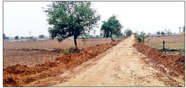
जीद। खेड़ी मंसानिया से उचाना खुर्द को जाने वाली रास्ते को पक्का करने के लिए चल रहा काम।

खेड़ी मंसानिया के लोगों को उचाना खुर्द जाने के लिए अब लंबा चक्कर नहीं काटना पड़ेगा। खेड़ी मंसानिया से लेकर उचाना खुर्द जाने वाले कच्चे रास्ते को पक्का बनाया जाएगा। पीडब्ल्यूडी द्वारा करीब 60 लाख रुपये खर्च करके इस रास्ते को बनाया जा रहा है। 18 फीट की चौड़ी बनने वाली सड़क का निर्माण शुरू होने से ग्रामीणों, किसानों एवं वाहन चालकों की मांग पूरी हुई है। दोनों गांव की दूरी 1700 मीटर के आस-पास है। खेड़ी मंसानिया के ग्रामीणों,